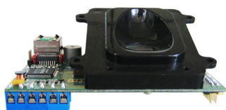
Módulo Biométrico Ethernet FS 84C