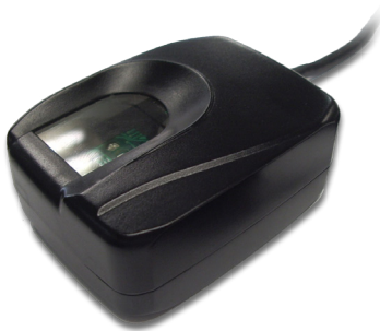
CIS FS 80H DT

CIS distribuidora exclusiva FUTRONIC Brasil